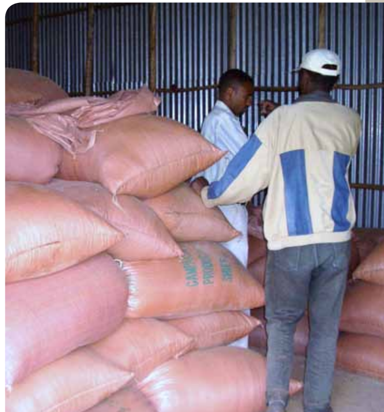
Bankieren met graan. De lokale boeren zijn zowel klant van de bank als de bankier. Zij leveren het graan en beslissen of ze het verdelen of verkopen tijdens het droge seizoen.

In het gebied Shewa, in de regio Oromo, hebben verscheidene huishoudens begrepen dat hun solidariteitsband binnen de « idr » ook kan worden gebruikt om andere problemen op te lossen, zoals de gebrekkige voedselautonomie. Met de steun van OSRA en HUNDEE hebben verschillende huishoudens zo'n 30 graanbanken opgericht.