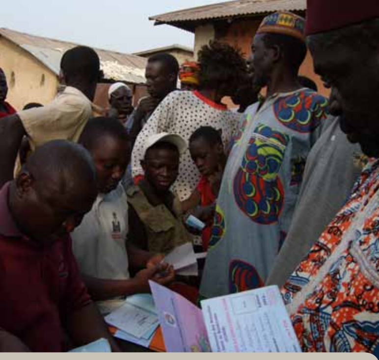
De bewoners van een district in Bembèrèkè maken zich lid van de lokale mutualiteit. Ze krijgen een lidkaart die ze bij elk bezoek aan het gezondheidscentrum of het hospitaal moeten voorleggen om te kunnen genieten van de verminderde kostprijs.

Zo telt het gezondheidscentrum van het arrondissement Tuko Saari bijvoorbeeld 4 keer meer bezoeken van patiënten dan in de rest van het land.