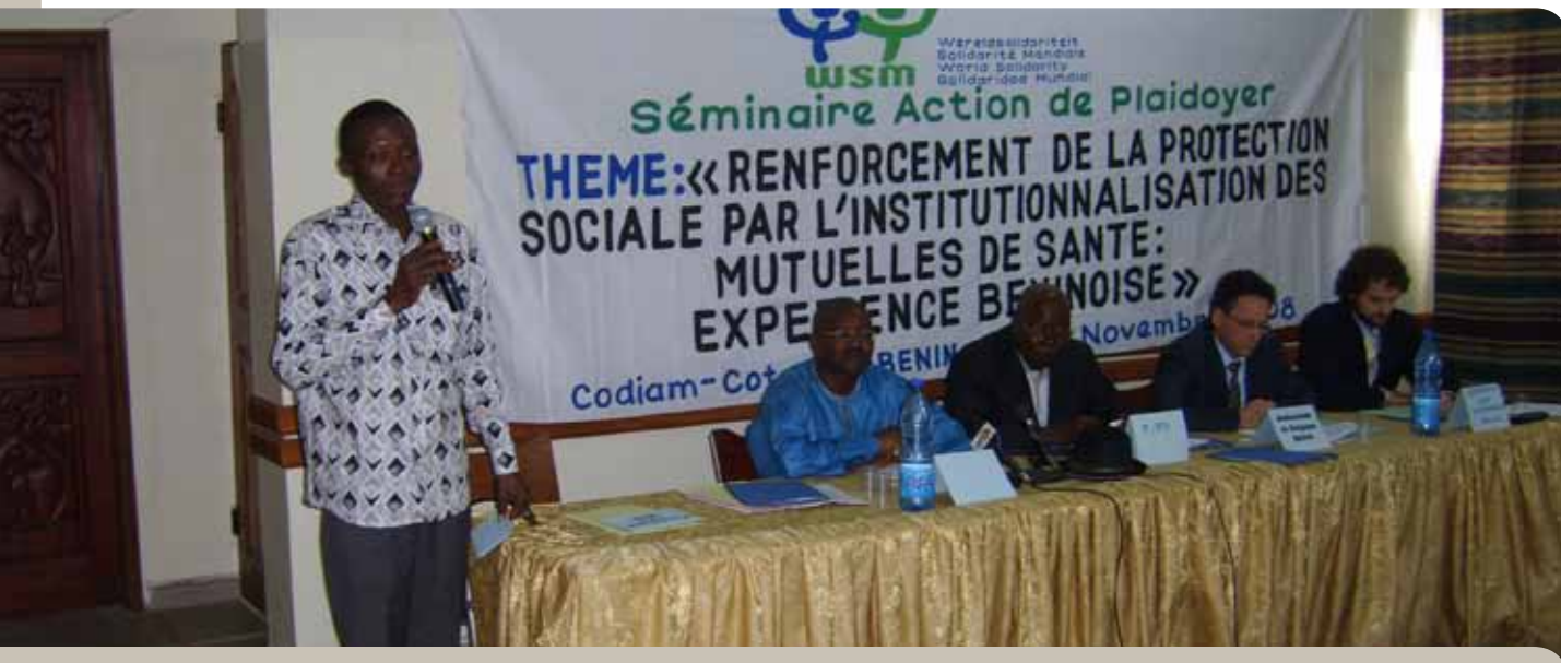
PROMUSAF Bénin en WSM lobbyen: ze vragen het Ministerie van Gezondheid en de internationale donoren om de mutualiteiten te erkennen en hen een structurele plaats te geven in het opmaken en uitvoeren van het nationale gezondheidsbeleid.

De impact van de mutualiteiten op de gezondheid van de mensen laat zich al voelen, want de gemiddelde kostprijs van een tenlasteneming in de verschillende gezondheidscentra in Bembèrèkè is op drie jaar met 47% verminderd . Maar de mutualiteiten willen nog verder gaan. Door lobbying en sensibilisering willen ze erkend worden door de overheid en de gezondheidsinstellingen als structurele actoren in de uitbreiding van de sociale bescherming. Zo willen ze komen tot een nationale gezondheidsdialog met deze actoren om de samenwerking te optimaliseren en zodoende te komen tot een toegankelijke gezondheidszorg voor iedereen.