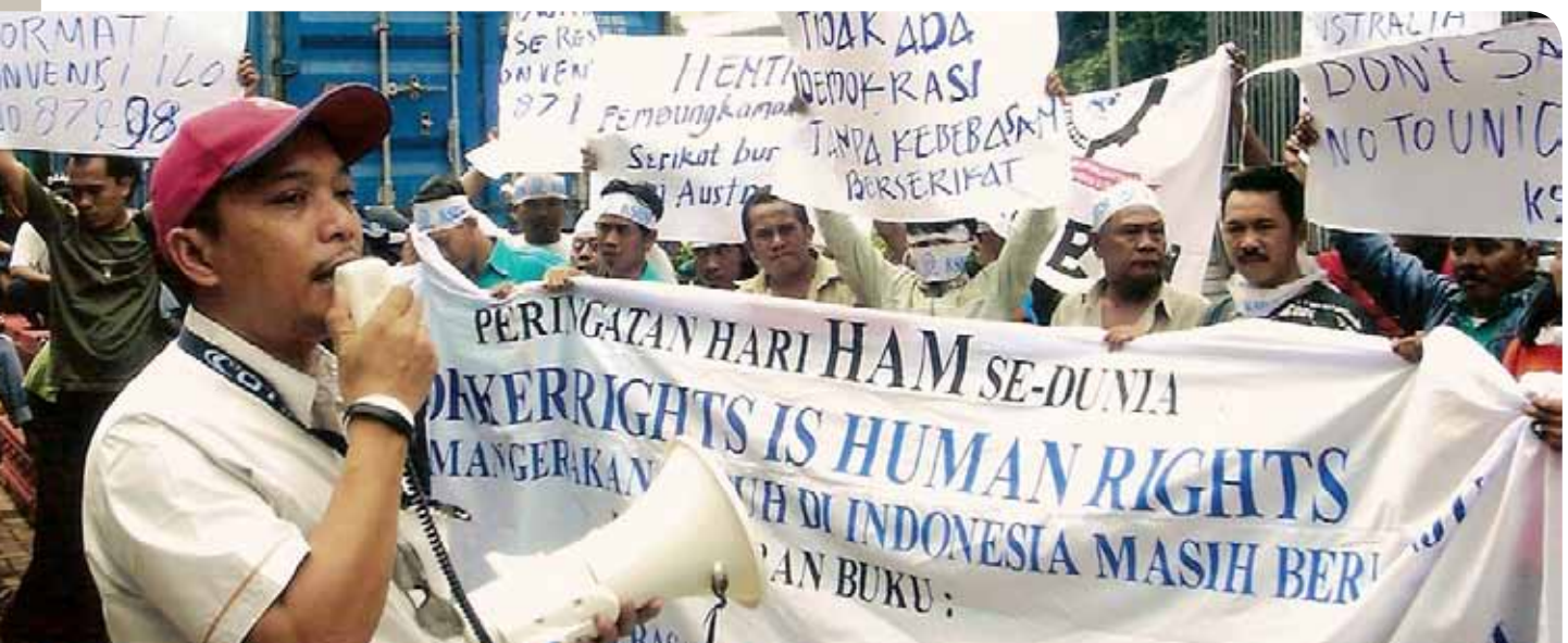
Mensen organiseren zich, om sterker te staan.

Sociale bewegingen staan dicht bij de mensen en krijgen daarom een mandaat om hun stem te vertegenwoordigen (representativiteit). De beweging ontwikkelt haar maatschappijvisie en voert die uit door enerzijds heel concrete acties te ondernemen. Anderzijds verdedigt zij die visie bij beleidsmakers en roept zij hen op om de specifieke bijdrage en acties van sociale bewegingen