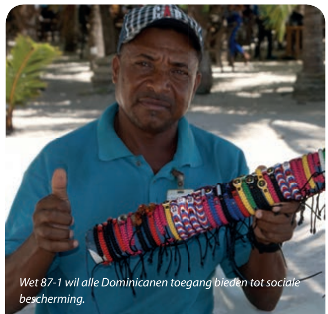
Wet 87-1 wil alle Dominicanen toegang bieden tot sociale bescherming.

Voor de Seguro de Riesgos Laborales , bestaat er slechts één openbare Administratie, namelijk de ARL ( Administración de Riesgos Laborales ).