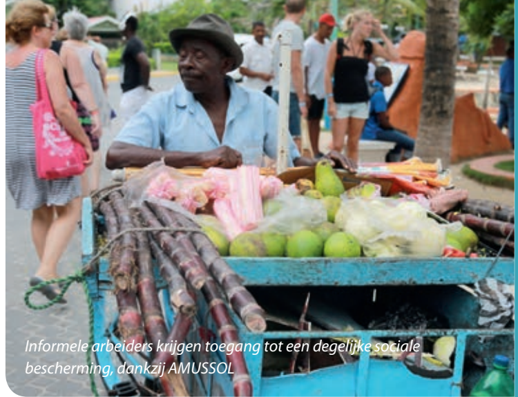
Informele arbeiders krijgen toegang tot een degelijke sociale bescherming, dankzij AMUSSOL

In de praktijk regelt de grote meerderheid van het aangesloten huispersoneel de aansluiting via hun vakbond. Het is voor hen immers zeer moeilijk om met de werkgever in discussie te treden en hem te overtuigen om 70% van het bedrag van de sociale bijdrage te betalen. Bovendien zijn het meestal de vertegenwoordigers