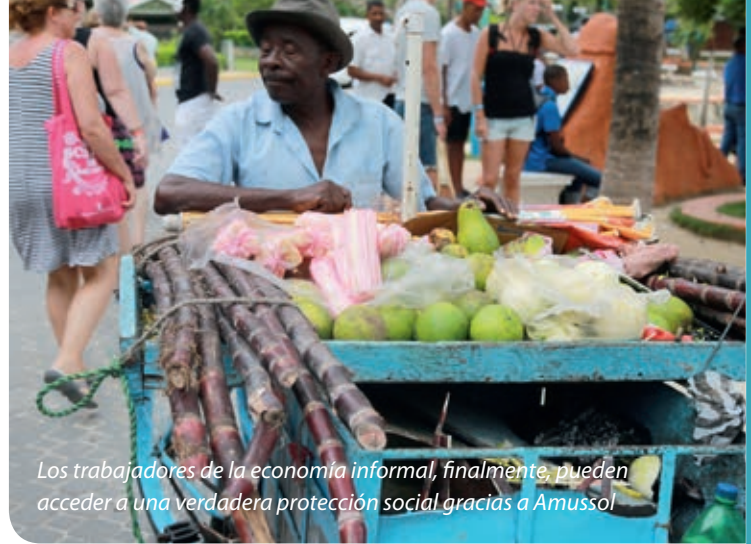
Los trabajadores de la economía informal, finalmente, pueden acceder a una verdadera protección social gracias a Amussol

En la práctica, casi todos los/las trabajadores/as domésticos/as están afiliados/as a través de su sindicato. De hecho, es muy difícil para ellos hablar con su empleador y convencerlo de pagar el 70%