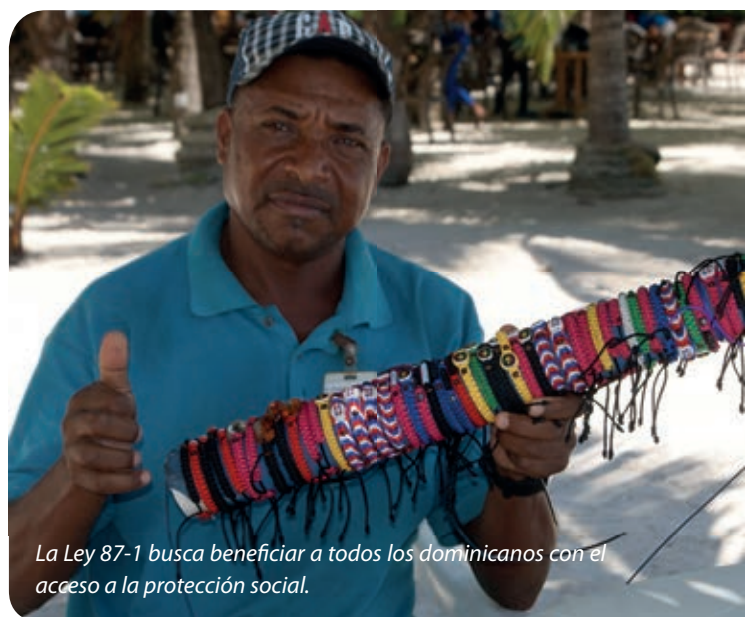
La Ley 87-1 busca beneficiar a todos los dominicanos con el acceso a la protección social.

Para el servicio de Seguro de Riesgos Laborales , sólo hay un órgano público. Se trata de la ARL (Administración de Riesgos Laborales).