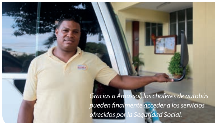
Gracias a Amussol, los choferes de autobús pueden finalmente acceder a los servicios ofrecidos por la Seguridad Social.

El principal servicio que ofrece Amussol a sus beneficiarios-as es el de contar con el acceso al Sistema Dominicano de Seguridad Social. Como se explicó anteriormente, el modelo actual no permite a los trabajadores y empleados de la economía informal acceder a la seguridad social establecida por el Gobierno. Es en este