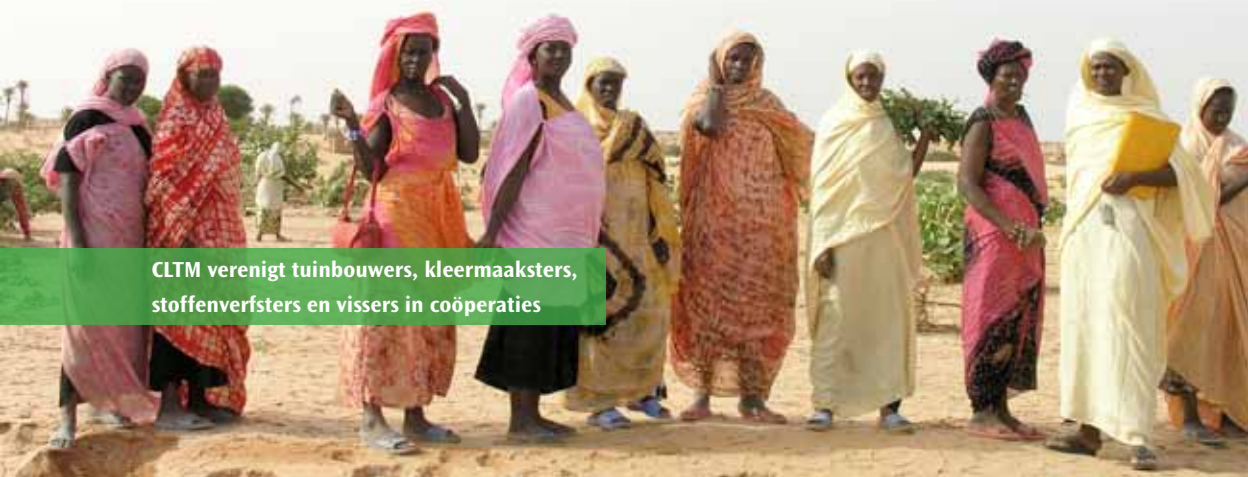
CLTM verenigt tuinbouwers, kleermakers, stoffenverfsters en vissers in coöperaties

CLTM verenigt tuinbouwers, kleermakers, stoffenverfsters en vissers in coöperaties. Er zijn alfabetiseringscursussen, vormingen rond ondernemerschap en verkooptechnieken; en technische vormingen zoals stoffen verven, couture of landbouwtechnieken. Via kleine leningen helpt CLTM de coöperaties met de aankoop van zaaigoed en tuingereedschap. Dankzij de coöperatie kunnen de leden zich aansluiten bij sociale zekerheidssystemen en zo toegang krijgen tot betaalbare gezondheidszorg.