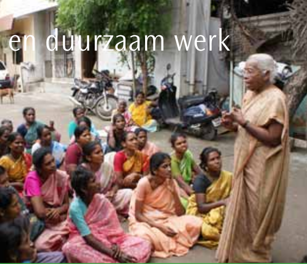
vorming voor huispersoneel door NDWM

bouw- of visserijsector, of als huispersoneel. Bij GEFONT bereiden we mensen die willen emigreren zo goed mogelijk voor. We informeren hen over hun rechten en plichten, we helpen bij het in orde brengen van hun papieren en vergunningen en adviseren hen zo goed als we kunnen. We hebben kantoren in de migratielanden, daar kunnen Nepalese arbeidsmigranten terecht met problemen en klachten. Wij helpen en geven raad. We bemiddelen bijvoorbeeld bij ambassades voor diplomatieke steun, als er problemen zijn.