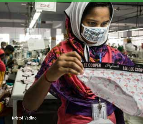
onze kleding: made in Bangladesh

We worden steeds meer en intenser geconfronteerd met de impact van vervuiling en klimaatverandering . Water- of luchtvervuiling en bodemdegradatie maken hele regio's onleefbaar. Natuurrampen verjagen mensen van hun woonplaatsen. De voorraad fossiele brandstoffen waarmee wij onze industrie draaiende houden, is eindig. We