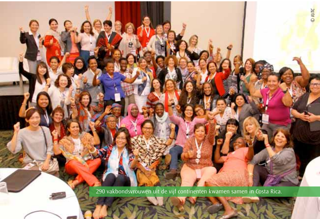
290 vakbondsvrouwen uit de vijf continenten kwamen samen in Costa Rica.

die vrouwen aanbelangen zoals vrede, democratie, waardig werk en de toekomst van werk. Concrete verhalen inspireerden en motiveerden om met hernieuwde moed ons steentje bij te dragen aan meer gendergelijkheid. Want zoals één van de sprekers het treffend verwoordde "If we have no fight, there is no victory..."